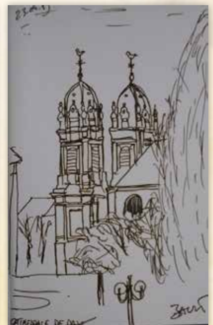
La cathédrale vue par Robert le pèlerin