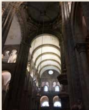
Cathédrale de Santiago