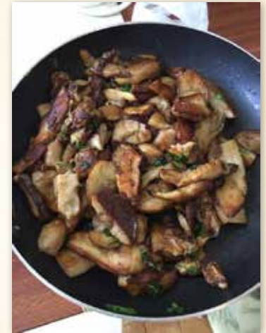
... et préparés par les pèlerins à Saint Paul

Or il semble que certains volontaires potentiels soient réticents face à une tâche qui leur paraît dépasser leurs compétences : la préparation des repas. A Miramont-Sensacq sur la voie du Puy, à Vialotte et Roquefort sur la voie de Vézelay, à Sorde sur la voie de Tours, où l'hospitalier dispose d'une chambre, il est de tradition de préparer et partager le repas du soir avec les pèlerins. Éplucher les légumes et les fruits pour la