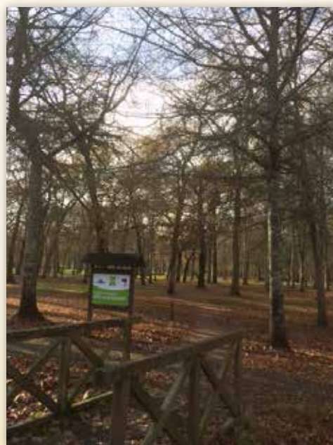
Le Bois de Boulogne