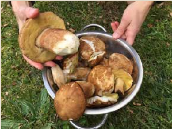
Cèpes trouvés sur le chemin de Tours

Dans le dernier numéro nous lançons un appel aux adhérents pour les convier à l'expérience de l'hospitalité. Des témoignages rappelaient combien cette mission s'avère gratifiante, riche en rencontres et en partages au sein des refuges et gîtes dont la gestion nous incombe sur les voies landaises.