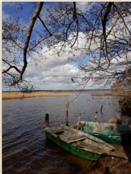
Aureilhan sur la voie du littoral

À ce propos, le site de Bouricos a reçu cette année trois fois plus de pèlerins. Situé sur la traverse Labouheyre – St Paul en Born, c'est-à-dire de la Voie de Tours vers la Voie du littoral, il semble que « la pompe s'amorce ». La présence d'un accueil permanent, un site au charme bucolique indéniable, une quiétude absolue pour se ressourcer sur un « arial de chez nous » magnifique font que les retours sont excellents. Espérons que comme à Mimizan, Bouricos profitera favorablement du bouche à oreille... ou plutôt de Facebook.