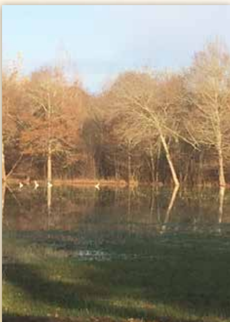
Barthes de l'Adour

Nous pourrons nous garer sur le parking du Pouy, l'ancien grand séminaire lazariste de Dax (rue du Père Peyboyre), et marcher ensemble le long de l'Adour puis vers le Bois de Boulogne en direction des barthes de l'Adour (promenade d'une heure à une heure et quart de marche pouvant être raccourcie ou rallongée à volonté).