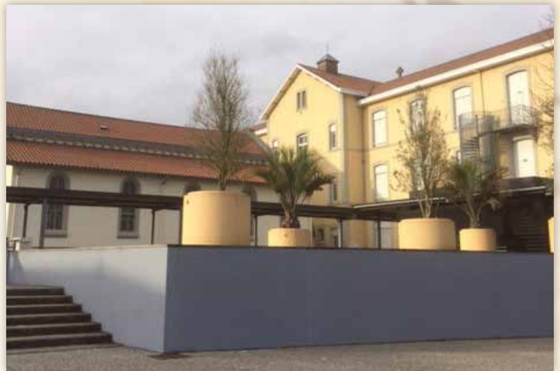
Groupe scolaire St Jacques de Compostelle à Dax

La rue Paul Lahorgou est à sens unique. La prendre depuis le Boulevard Roland Garros , elle débouche au rond-point de l'hélicoptère. Se garer sur le parking devant l'établissement.